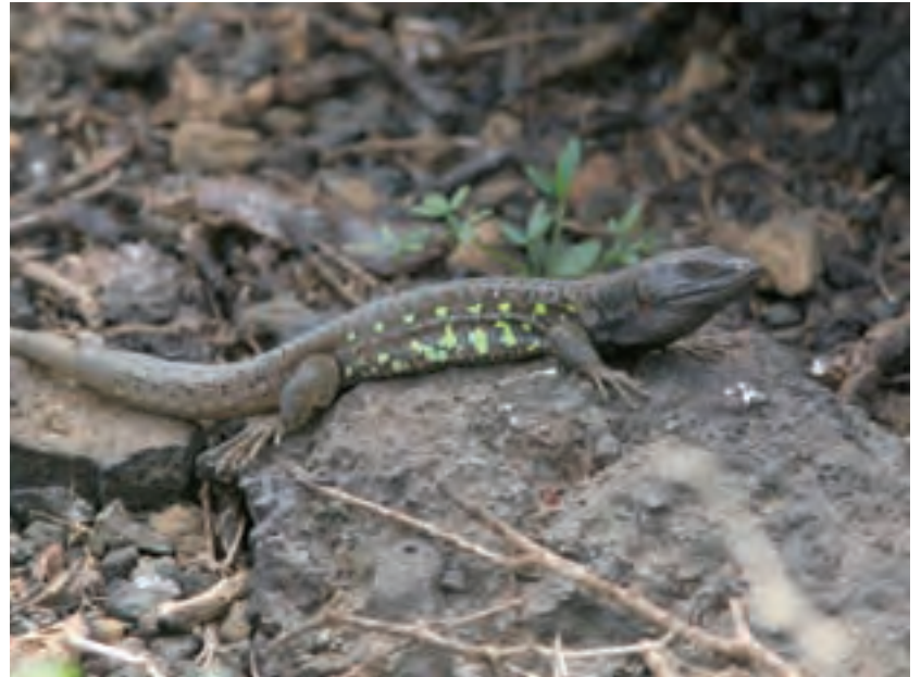
Die größten Exemplare der Atlantik Eidechse ( Lacerta atlantica ) kann man an den Hängen des Corona beobachten.

hängende Bartflechten an, wie feucht es in diesem Gebiet häufig ist. Schließlich verlässt man die Anbauzone und kommt in die weitgehend vom Menschen unberührten Teile unterhalb des Kraters. Sie sind im Frühjahr mit hellem Blau überzogen, das von einem auf Lanzarote endemischen Natternkopf, Echium lancerottense , herrührt. Auffällig ist auch der gelb blühende Großblättrige Kanarenhahnenfuß ( Ranunculus cortusoides ). Versteckt in Felsspalten finden