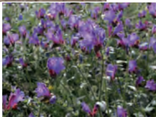
Foto oben: Samtkopfgrasmücken brüten auf Lanzarote nur in der Nähe des Corona. Unten: Der Lanzarote Natternkopf (Echium lancerottense) blüht in großer Zahl an den Hängen des Corona.

Von der Sonne getrocknet wird der so entstandene Sand dann im Einfluss des stetig wehenden Passatwindes ins Hinterland getrieben und zu gleißend weißen, hohen Dünen im schwarzen Lavafeld aufgetürmt. Aufgefangen wird er von Pflanzen wie Balancón ( Traganum moquinii ), die dazu verdammt sind, immer weiter in die Höhe zu wachsen, um nicht im Sand begraben zu werden. Dabei kommen ihre