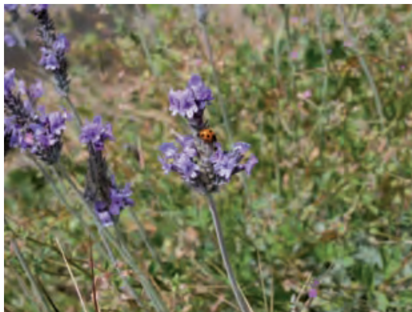
Der fiederblättrige Lavendel (Lavandula pinnata) kommt nur auf Lanzarote und Fuerteventura vor.

Wenn man sich zur Rast etwas länger und ruhig im Windschutz einer Mauer nieder lässt, kann man weitere interessante Beobachtungen machen. Sehr bald wird man feststellen, dass das Umfeld lebt. Hier kommen nämlich die größten Eidechsen von Lanzarote vor. Die grünlich gefleckten Männchen der Atlantischen Eidechse ( Lacerta atlantica ) können bis zu 30cm lang werden. Im Frühjahr sind sie unentwegt auf der Suche nach paarungsbereiten Weibchen und daher etwas unvorsichtiger.