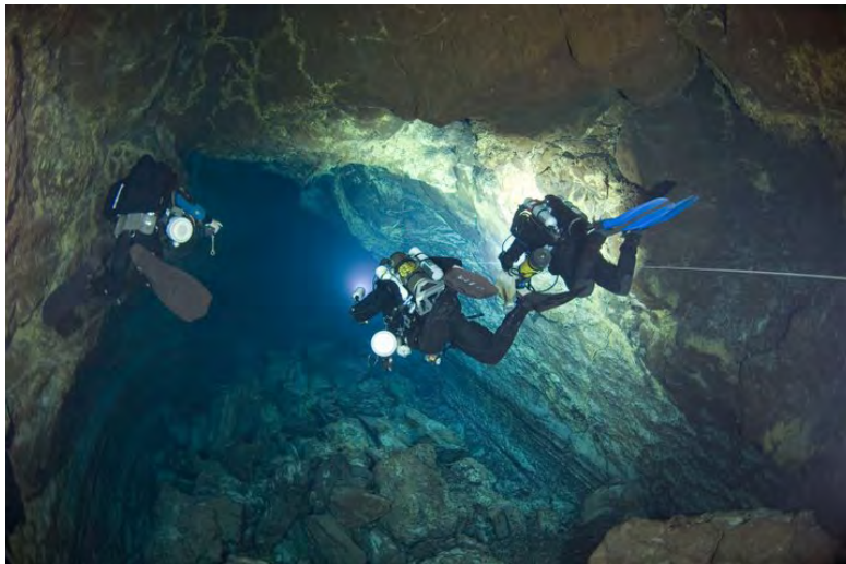
Abb. 2. Taucher in der untermeerischen Lavahöhle auf der Kanarischen Insel Lanzarote. Foto © Jill Heinerth.