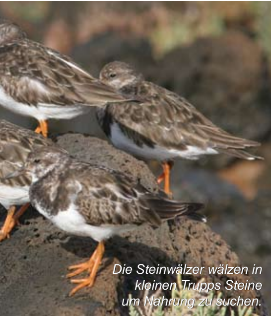
Die Steinwälzer wälzen in kleinen Trupps Steine um Nahrung zu suchen.

kunstvoll die Wellen abreiten oder Einheimische, die gelegentlich kleine Krebse als Angelköder im Felswatt suchen. Störend ist, dass hier gerne Hunde von der Leine gelassen werden und diese weit umherstreunend dadurch Brut- und Rastvögel unnötig aufscheuchen und beunruhigen, oder dass bei Ebbe mit dem Mountainbike durchs Watt gefahren wird. Es wäre sicherlich auch einmal angebracht, den angeschwemmten