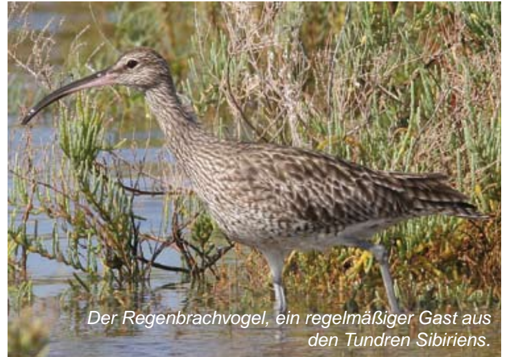
Der Regenbrachvogel, ein regelmäßiger Gast aus den Tundren Sibiriens.

Gegebenheiten haben einen vergleichsweise ausgedehnten Lebensraum entstehen lassen, in dem der Meeresboden periodisch zweimal täglich im Rhythmus der Gezeiten überschwemmt wird und wieder trocken fällt.